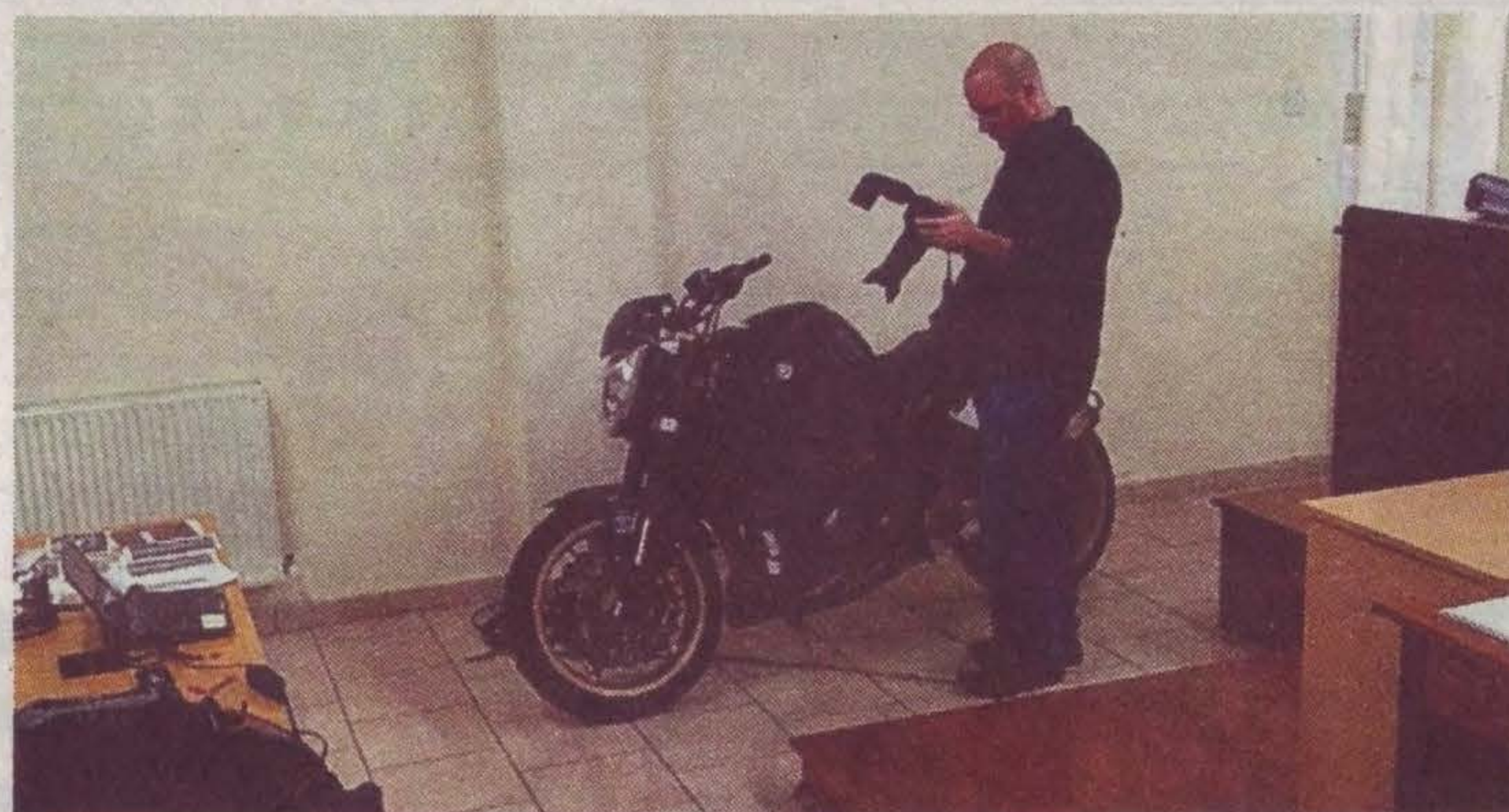
בדיקת האופנוע בזירת הרצח בקפריסין

בלדינגר, תושב כפר סבא כבן 40, שעבד כמהנדס אלקטרוניקה בחברת היי-טק, החל את דרכו בתחום כשהמשטרה פנתה אליו לפני כשש שנים וביקשה את עזרתו בפענוח תצלומי וידאו מזירת פשע. המכשירים החדישים, הטכנולוגיה המתקדמת, ההתמחות בתחום והרצון לחשוף את האמת בכל מחיר, הופכים אותו לאמן של ממש. לעתים גם הוא מתקשה להאמין שכך נראים ומתנהלים חיייו, אך לרבריו "מעבר לטירוף יש סיפוק אמיתי וגדול כשאני מצליח להוכיח שמישהו חף מפשע, או להיפך".