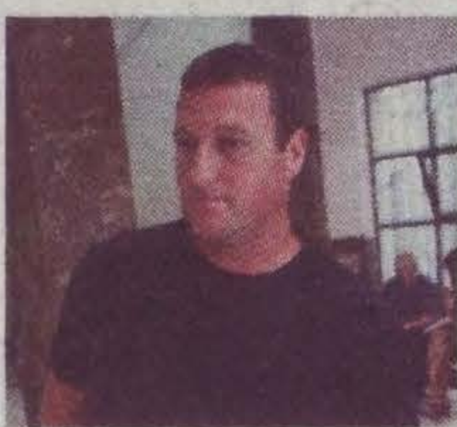
ליצשטיין. נפגע מהחזיז

איצטדיון מלחה, נובמבר 2007, חזיז מושלך מיציע האוהדים ופוצע את אחד המאבטחים. המשטרה עצרה ארבעה חשודים, אך לא הצליחה לזהות מי השליך את החזיז. בדיקות המעבדה קבעו זאת בבירור