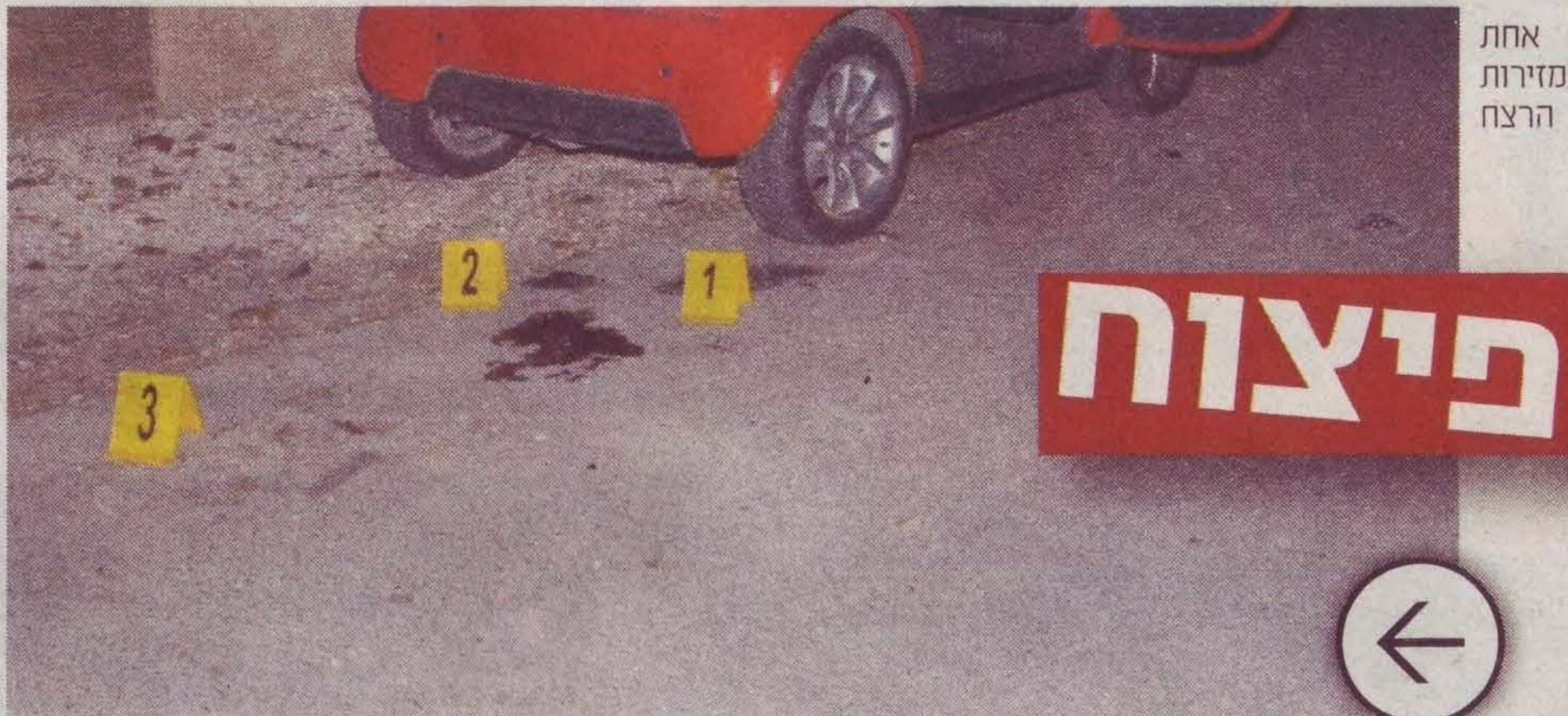
אחת מזירות הרצח

רשת "עד 120" הייתה בין הראשונות, שפעלו בתחום הדיור המוגן בישראל ומובילה מאז שינוי בתפיסת דיור הולם ויקרתי לגיל המבוגר.